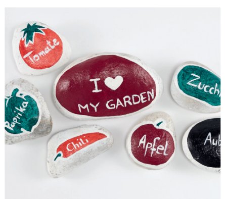
Zum Schluss die Farbe noch mit Klarlack fixieren, ein letztes Mal trocknen lassen, fertig!

Viele weitere DIY-Anleitungen finden Sie hier: universal.at/ garten