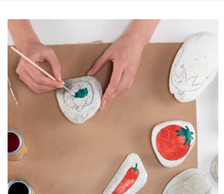
Die Umrisse mit den Acrylfarben ausmalen (ca. 2–3 Farbschichten) bis es gut deckt und gut trocknen lassen.