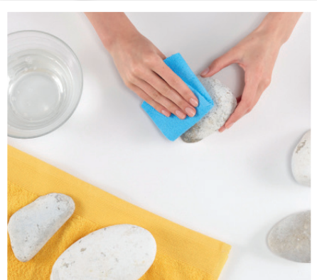
Die Flussteine waschen und auf dem Handtuch gut trocknen lassen.