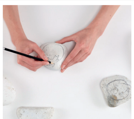
Die Umrisse des Gemüses mit dem Bleistift auf den Stein zeichnen.